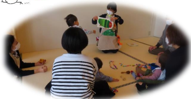
『おしゃべりたいむ』 ママのおしゃべりのあとは子どもの時間♪