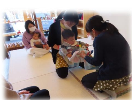
『わらべうたであそぼう！』 シーツぶらんこに挑戦！

お花があちらこちらで咲きほこり、気持ちのいい季節になりましたね。 春は新しく生活リズムが変わる季節でもあります。無理せず、おひとりおひとりに 合ったペースで歩みを進めてくださいね。私たちも応援しています。 ゆったり、ほっこりとできる空間づくりを心掛けながら、皆さんとお会いできること を楽しみにお待ちしております♪