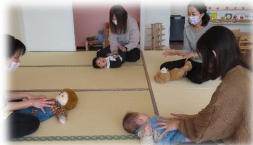
『タッチケア』 ゆったりやさしくね♡