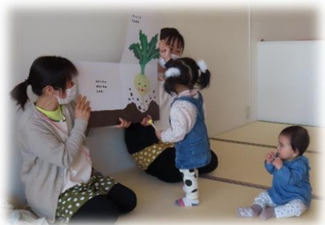
『えほんたいむ』大型絵本をみたよ♪